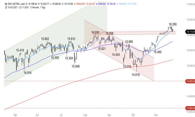
Stand: 23.11.2021, 7:00 Uhr